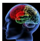
De werking van ons brein tijdens stress

Binnen het domein crisismangement geven we organisaties structuur en richting en leren we ze vooral hoe reacties vanuit ons stress-systeem ontstaan en hoe we deze kunnen reguleren. Vanuit deze stap gaan we aan de slag met structuren die praktische ondersteuning geven bij het leiden geven en coördineren van een crisis. Hierbij gaat het niet alleen om planvorming, maar vooral om realistische prestatie in de praktijk. Een training of opleiding moet vol staan van passie en energie. Dat is waar ik voor sta.